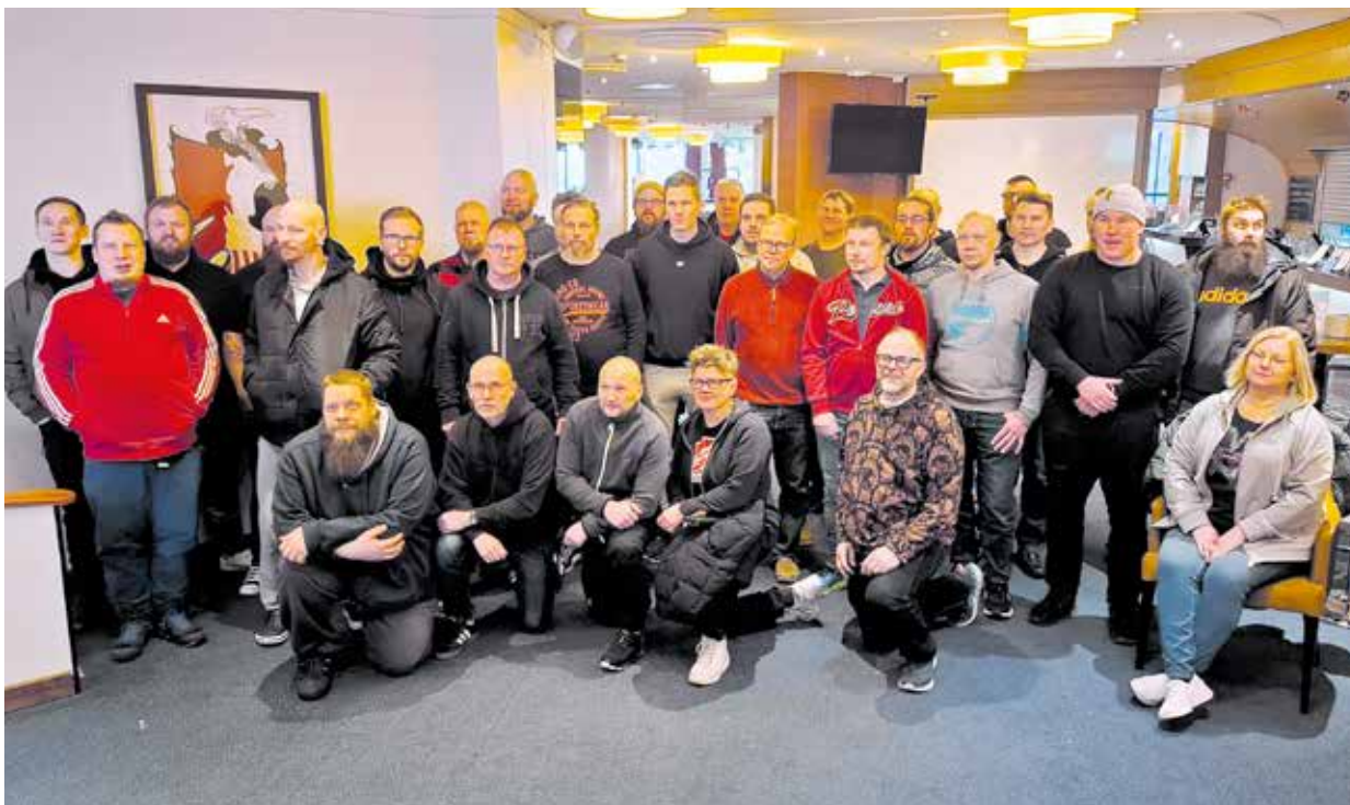
Pilottikurssin osanottajista puolet oli sähköliittolaisia, puolet rakennusliittolaisia.