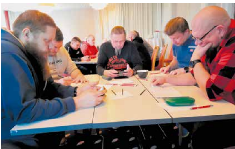
Aloituspäivänä luottamushenkilön oikeuksia etsittiin omista työehtosopimuksista.