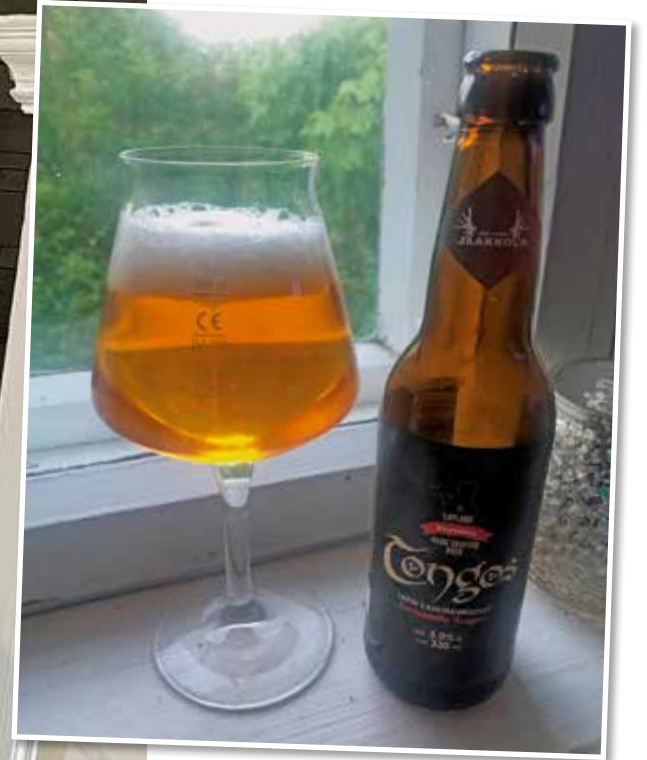
Oluita löytyy joka lähtöön. Tässä Ruususen ja Kanavan Panimon yhteisellä reseptillä tehdyssä oluessa maistuu hieman savustettu nauris.