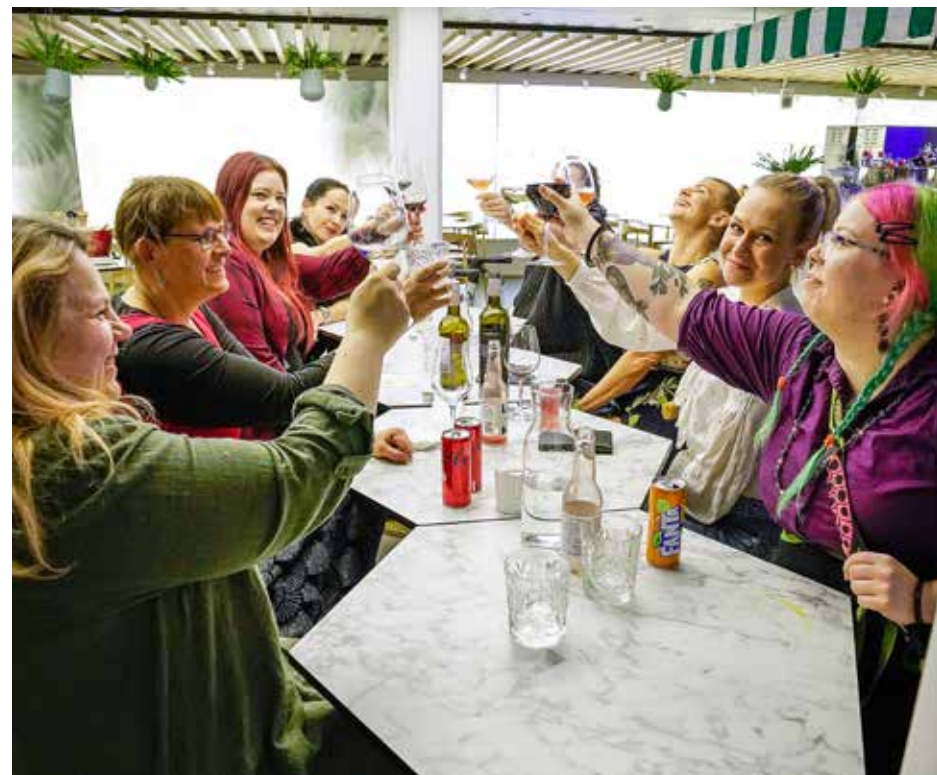
Helsingin ammattiosasto on perustamassa naisjaostoa. Aloitustilaisuus järjestettiin lokakuun lopulla, ja tammikuussa on vuorossa järjestäytymiskokous. Lue lisää jaoston tavoitteista sivulta 18.