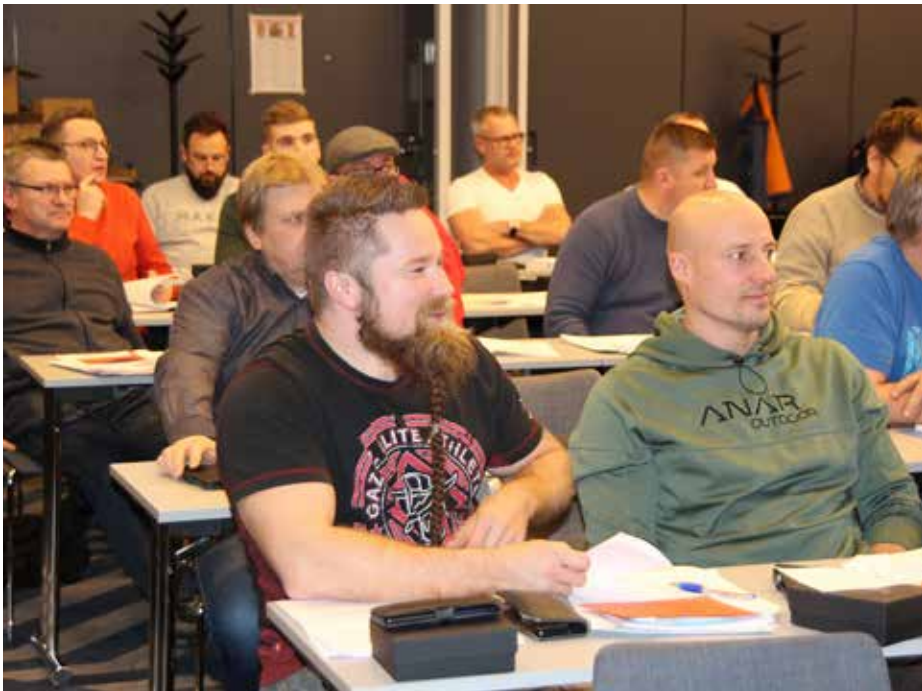
Syysedustajisto kokoontui vain pari kuukautta kevätedustajiston jälkeen, sillä koronatilanne siirsi kevätkokouksen syyskuulle.